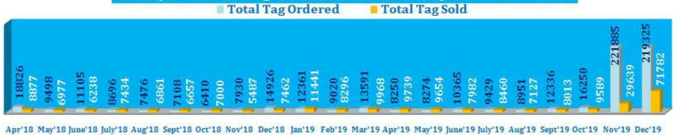
Monthly Trend of FASTag Ordered and Sold Status : April '18 - December '19

लेनदेन का मासिक चलन (ऑर्डर और बिक्री) नीचे दिए गए चार्ट में दिखाया गया है -